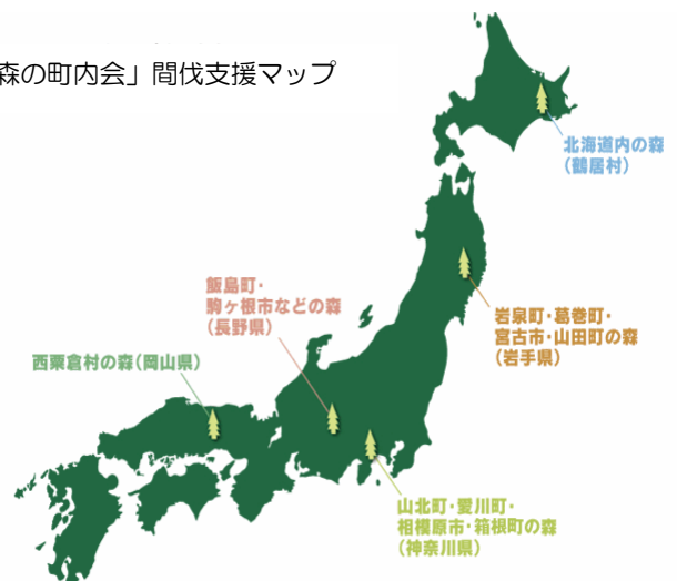
「森の町内会」間伐支援マップ

森の町内会 ☎ 検索！ http://www.mori-cho.org/index.html