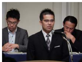
(左：濱口委員長、右：古波蔵委員長代理)