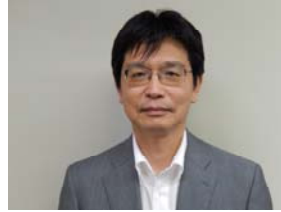
大木特別中央執行委員