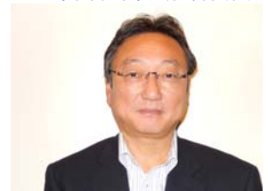
傳田特別中央執行委員