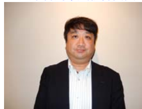
藤井特別中央執行委員