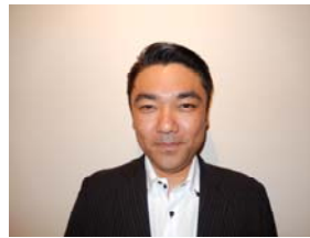
又吉中央執行委員