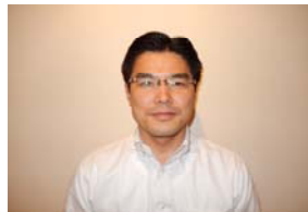
岩堀前中央執行委員