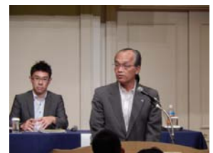
南雲連合事務局長