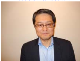
直田中央執行委員