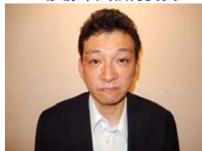
中谷中央執行委員