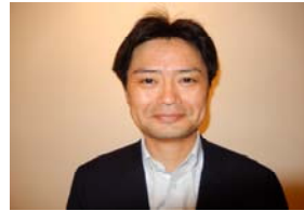
藤枝前中央執行委員