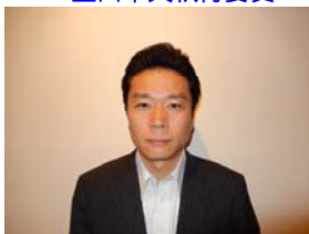
岡田中央執行委員