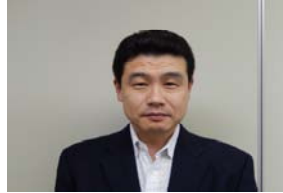
大園前組織局次長