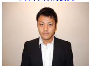
中山中央執行委員