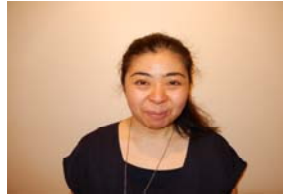
高寺前中央執行委員