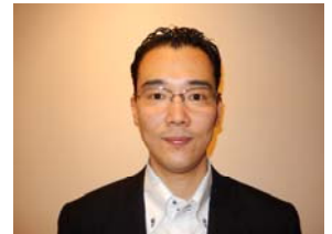
山尾特別中央執行委員