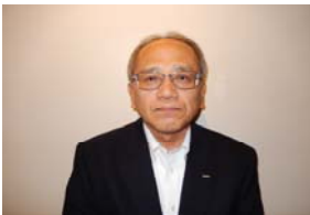
岡前中央執行委員