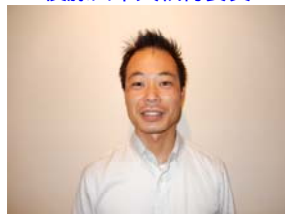
加藤中央執行委員