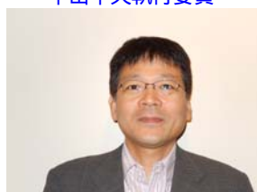
本村中央執行委員