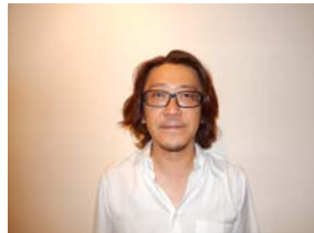
後藤田中央執行委員