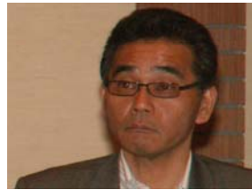
松本特別中央執行委員