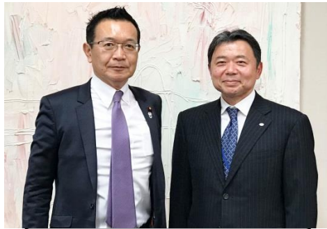
川内博 衆議院議員 (予算委員会 委員)