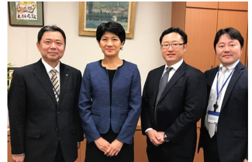
西村智奈美 衆議院議員 (厚生労働委員会 理事)